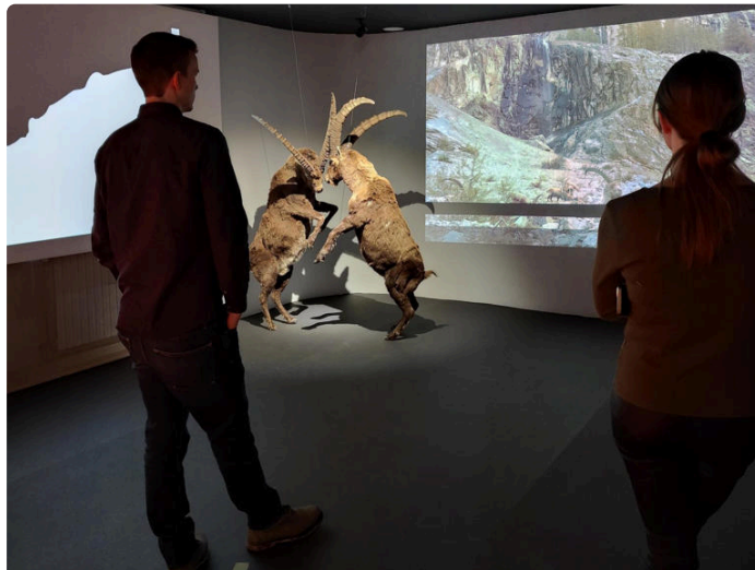
Riaprono i centri visitatori del Parco del Gran Paradiso

Storia di KAI • 1 mese/i • 2 min di lettura